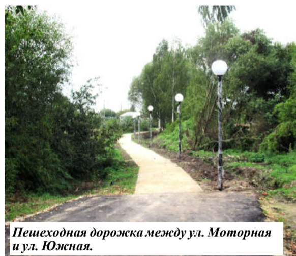
Пешеходная дорожка между ул. Моторная и ул. Южная.

Не менее важным стало участие местной админи-