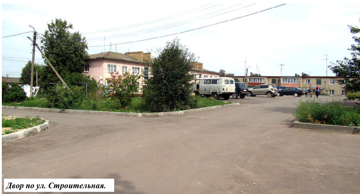
Двор по ул. Строительная.