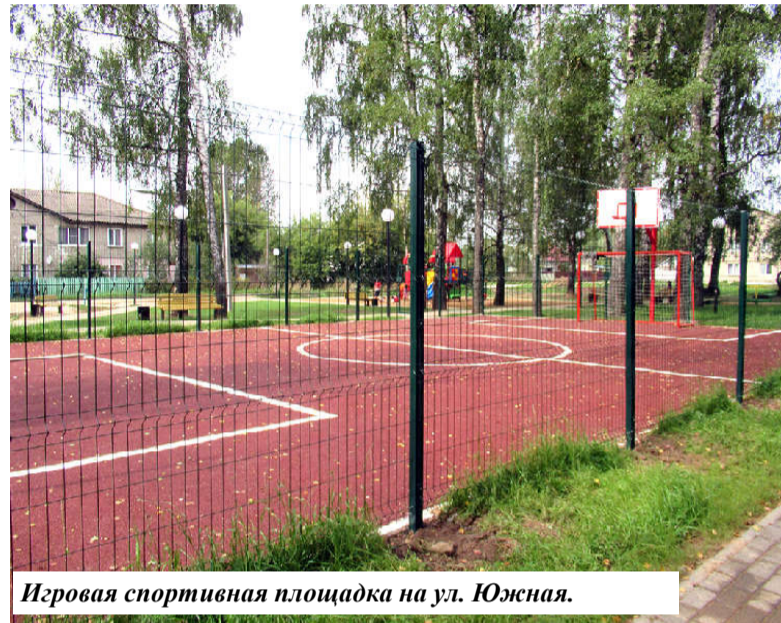
Игровая спортивная площадка на ул. Южная.

И еще одним крупным объектом строительства этого года стал сквер им. Н.П. Пухова расположенный на одноименной улице. Проходящая вдоль железной дороги, эта улица, как и названные выше, достаточно удалена от центра. Из этого микрорайона не прогуляешься с ребенком до парка. И строительство здесь сквера очень важно для проживающего здесь населения, особенно молодых мам. Объект стоит более